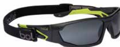
MERPSF + RUSHKITS