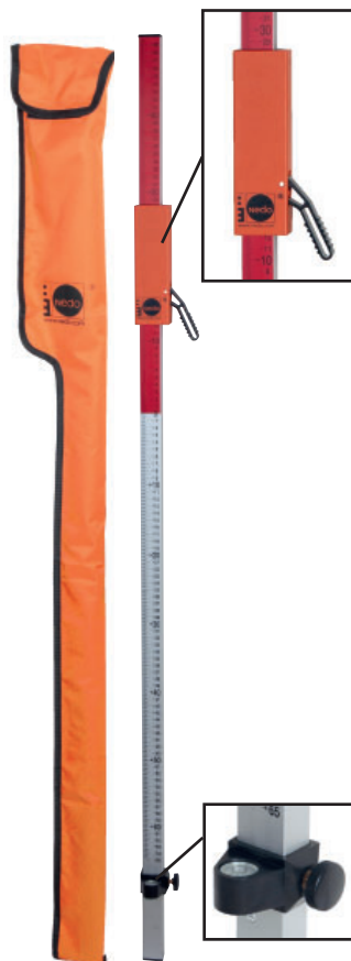
Miras flexi set QualiLine N° ref. 360 916-622