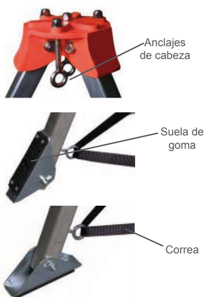
Trípode TRI 9 Detalles